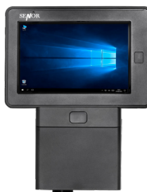
Station murale scanning